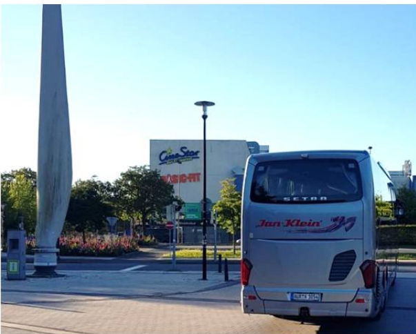
Da geht er hin...