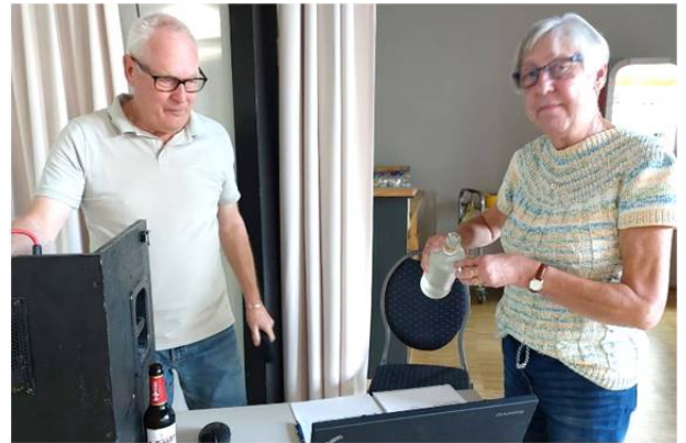
Ein Schnäpschen in Ehren...

Und da eine solch kräftezehrende Tätigkeit irgendwie ausgeglichen werden muss, wurde am frühen Abend wieder eine leckere Gulaschsuppe (von Zahmel) gereicht.