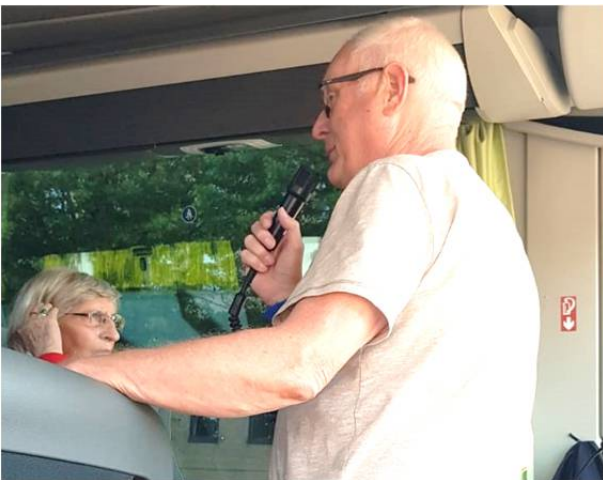
Ansprache des Vorsitzenden: „schön brav sein und nicht mit den Fingern in den Marmeladentopf!“