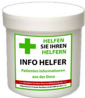
Dose mit Aufkleber